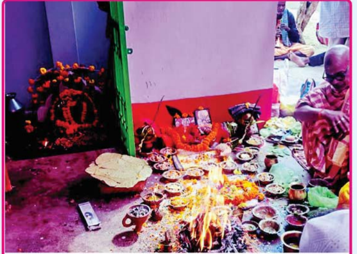
ତା. ୧୧.୧.୨୨ରେ ନୟାଗଡ଼ ଜିଲ୍ଲାର ବଡ଼ରାଉଳଙ୍କ ପୀଠରେ 'ରଥ କାଠ କଟାଯିବା' ପାଇଁ ପୂଜାର୍ଚ୍ଚନା ।