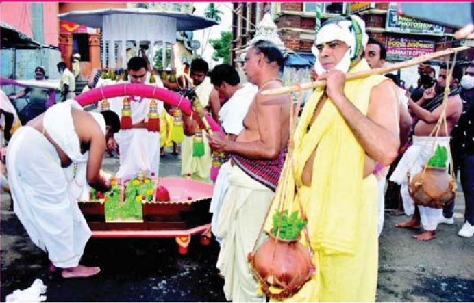
ତା. ୧୨.୧.୨୨ରେ ମକର ସଂକ୍ରାନ୍ତିର ଅବ୍ୟବହିତ ପୂର୍ବରୁ ଶ୍ରୀଜଗନ୍ନାଥ ବଲ୍ଲଭ ସମ୍ମୁଖରେ ଶ୍ରୀରାମ-କୃଷ୍ଣଙ୍କ ନିକଟରେ 'ଦୁଧମେଲାଣି ନୀତି' ଅନୁଷ୍ଠିତ ।