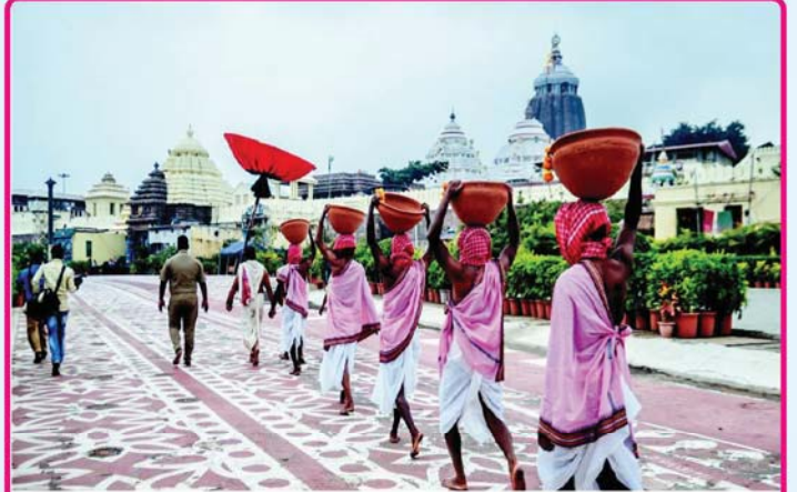
ତା. ୧୩.୧.୨୨ରେ ଶ୍ରୀମନ୍ଦିରରେ ମକର ସଂକ୍ରାନ୍ତି ଅବସରରେ ମକର ଋତୁକ ପ୍ରସ୍ତୁତି ପାଇଁ ଅଠରନଳାସ୍ଥିତ ମା' ଆଳାମତୃଣୀଙ୍କ ମନ୍ଦିରରୁ 'ମକର ତାଡ଼' ଶ୍ରୀମନ୍ଦିରକୁ ବିଜେ ।