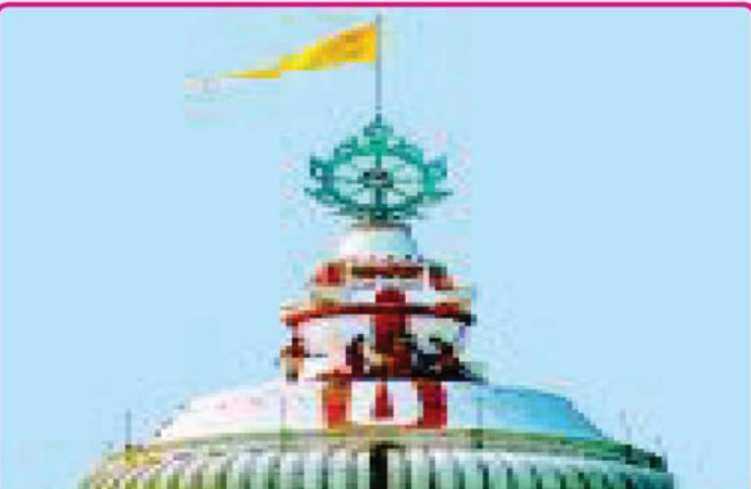
ତା. ୧୪.୧.୨୨ରେ ମକର ସଂକ୍ରାନ୍ତି ଅବସରରେ ଶ୍ରୀମନ୍ଦିର ନୀଳକୂଳ ପାଖ କଳସ ଏବଂ ଦଧିନଉତିରେ ଥିବା ରାମାନନ୍ଦୀ ଚିତାକୁ ଚୂନରା ସେବକମାନେ ଗେରୁ ଦ୍ଵାରା ଲେପନ କରୁଅଛନ୍ତି ।